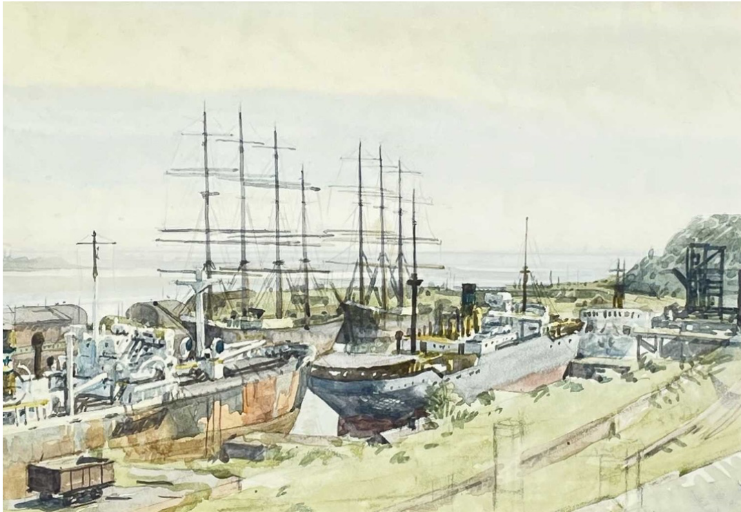
Der Hafen von Penarth mit den Windjammern Pamir und Passat. Gemalt von Arthur Weaver