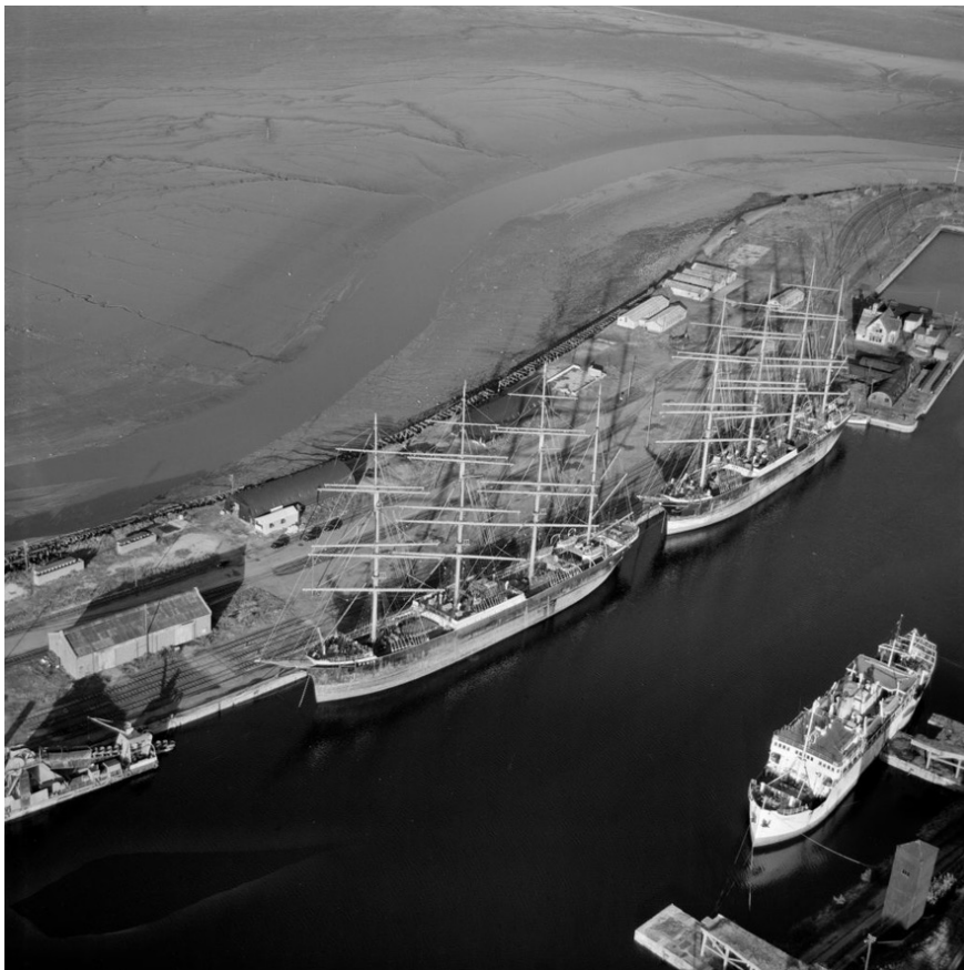
Die beiden Viermastbarken an der Pier in Penarth, Süd-Wales.